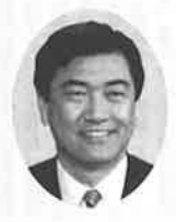
勝山市長 山岸正裕