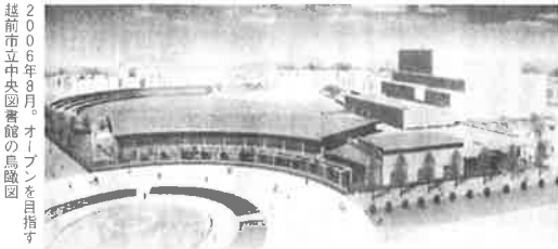
2006年8月、オープンを目指す 越前市立中央図書館の鳥瞰図

越前市 図書館建設を 予算化 06年8月完成 越前市は、「市立中央図書館」の建設に着手した。〇六年八月オープン予定。〔写真〕 新図書館の予定地は同市高瀬二丁目の中央公園内。市営球場と市文化センター中ホール、噴水に囲まれた東南の一角。建設費は十四億円を含み、総事業費は約二十億円。規模は延べ床面積約三千七百平方メートルで、現図書館(約千六百平方メートル)の二、三倍の広さ。鉄筋一部二階建て、二階部分は書庫。四十万冊の収蔵が可能で、公園の自然を生かし噴水に面して広い閲覧スペースを設けるほか、書棚の間隔を広げ車いすの通りやすくなる。またDVDやビデオの貸し出し、地域情報の中枢となるインフォメーションセンターを置くことも検討している。