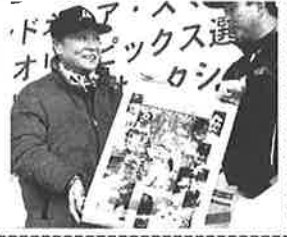
長嶋氏は右手にペンを輪ゴムで固定し、さらに左手を添えて、「長嶋茂雄」と書いてきた。また、同氏が「3」と書きこんだカレンダーが、この日最高の50万円で落札となった。選手のサイン入りパットなど24点も出品され、収益金16万8千円は新潟県中越地震やスマトラ沖地震の復興支援などに活用される。自営業者山田勝三さん（六〇）は「長嶋さんが右手で書いた精神を大事にしたい」と語った。（朝日2/19）