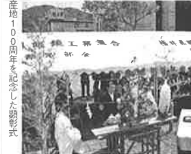
産地100周年を記念した顕彰式