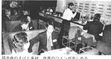
福井産のそばと食材、世界のワインが楽しめる「越前そばdining たけふ」

武生製麺(本社、武生市真駒町)の直営店「越前そばdining たけふ」が、銀座八丁目にオープンした。住所中央区銀座八十八五太陽ビルB1階、電話三五七二〇三三。地元産のソバ粉、食材にこだわらながら、創作料理とワインに力を入れており、しゃれた和の空間で気軽にそば会席が楽しめる。 銀座中央通り沿いの直営第一号店は五二、四坪。カウンターとテーブル、座敷合わせて六十七席を設けた。黒色を基調に鏡やガラスを効果的に使い、落ち着いた和の雰囲気を出し、壁面