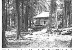
平泉寺白山神社一修験道三聖地のひめ神社とつ。参道は「日本の道100選」、と苔は「かおり風景100選」に選ばれています