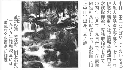
瓜割りの滝 若狭町(旧上中町)一九八五年昭和60年(一環橋村を水戸県に編入)

私の出身地は、福井県西部の若狭町(旧上中町)です。今思えばなにかの縁か、伊藤忠の三代目であった伊藤竹之助の出身地も若狭町でした。伊藤忠と福井の関係は古く、一九四六年の福井出張所開設以来のおつきあひとなります。繊維や機械などの分野で大変お世話になっております。