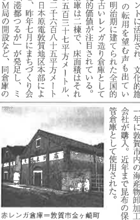
赤レンガ倉庫＝敦賀市金ヶ崎町

敦賀市は、日本原電から同市金ヶ崎町の赤レンガ倉庫の寄付を受けた。赤レンガ倉庫は市内の海産物卸加工会社が所有していたが、同社が寄付を見込んで購入した。建物、土地合わせた購入費用は四億二百八十万円。赤レンガ倉庫は敦賀港に臨む立地条件から近年は同市の各種イベントに活用され、文化的施設への転用を望む声も出ていた。明治期に建てられた全国的にも古いレンガ造り倉庫として歴史的価値が注目されている。倉庫は二棟で、床面積はそれぞれ五百三十七平方メートル、敷地二千六百八十五平方メートル。日本原電敦賀地区本部によると、昨年七月にまちづくり会社「港都つるが」が発足し、ミ