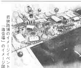
若狭路博のイメージイベント「海市場」のイメージ図

このたび建設する食のまちづくりに拠点施設「御食園会館(仮称)」は、若狭路博のメイン会場として大きな役割を担っていくことになり。若狭路博は、市民が参加の「市民のもてなしの心」を感じ、一人一役を担い、来場者らお待ち申し上げるの心かたで、ご支援、ご協力をお願い申し上げます。