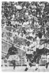
世界トップレベルのプレーにスタンドが沸いたメキシコ代表チーム。対東京ヴェルディのフレンドリーマッチ。三国町テクノポート福井スタジアム。

先に日韓両国で開催されたサッカー・ワールドカップでは、三国町がメキシコ代表チームのキャンプ地となり、町内外の多くのの方々のご支援を頂きました。 このキャンプによって、三国町の名前が国内はもとより、メキシコでも連日紹介されました。平成九年の重流出事故でも町の名が全国に知られ、それが、今回はこの暗いイメージから、世界最大のスポーツイベント、サッカー・ワールドカップで「ラテンアメリカメキシコ」の選手が活躍の場となることになりました。 私は、町のビール効果や経済効果もさることながら、今回のキャンプでの様々な交流を通じて、多くの子供たちが夢 た。このキャンプによって、三国町の名前が国内はもとより、メキシコでも連日紹介されました。平成九年の重流出事故でも町の名が全国に知られ、それが、今回はこの暗いイメージから、世界最大のスポーツイベント、サッカー・ワールドカップで「ラテンアメリカメキシコ」の選手が活躍の場となることになりました。 私は、町のビール効果や経済効果もさることながら、今回のキャンプでの様々な交流を通じて、多くの子供たちが夢