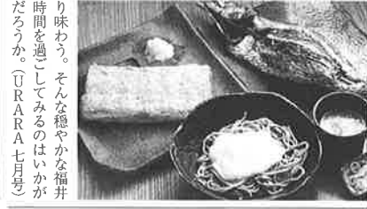
そば席 御清水庵 清恵(東京都中央区)