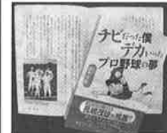
出版文化社(本社・大阪市)発行 定価 1,300円

先日開かれた選考会では山本会長のほか、作家の森哲郎氏、俳人の黒田杏子氏ら審査員が全国各地の候補地九十五カ所から観光資源を有する芭蕉ゆかりの市町村を絞り込んだ。北陸では同市のほか、石川県金沢市、小松市、山中町が選ばれている。 芭蕉は、「おくのほそ道」の旅で、現在の関東、東北、北陸、東海の一部十二県を約百六十日かけて巡った。敦賀には一六八九年八月十四日から少なくとも三日間滞在。氣比神宮や色ヶ浜などを訪ねたとされている。 「おくのほそ道」で詠んだ五十句のうち、敦賀に関するものは四句。敦賀から見る中秋の名月を賞しみにしていたとされ、雨に降られた十五日には「名月や北国日和定なき」と詠んでいる。市観光課によると、芭蕉にまつわる句碑や記念碑は市内に十七カ所。芭蕉の足跡をたどり、敦賀市を訪れる根強いファンは多いという。 同課は「芭蕉をテーマ型観光の目玉に位置付け、今後も積極的にPRしていきたい」と認定