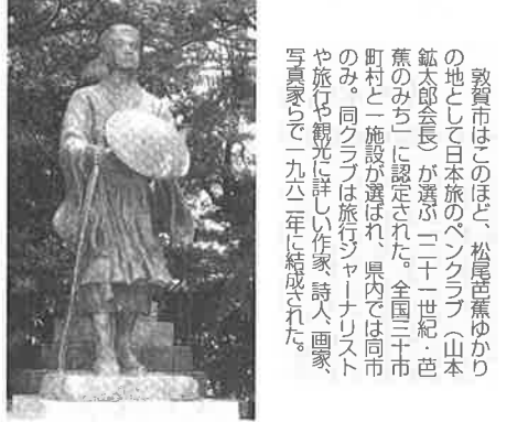
氣比神宮の松尾芭蕉像。敦賀市蔵町

「おくのほそ道」に4句句碑、記念碑17カ所 市、観光の目玉期待 敦賀市はこのほど、松尾芭蕉ゆかりの地として日本旅のベンチマーク(山本 鉦太郎会長)が選定された。全国三十市町村と一施設が選ばれ、県内では同市のみ。同クラブは旅行ジャーナリストや旅行や観光に詳しい作家、詩人、画家、写真家らで一九六二年に結成された。