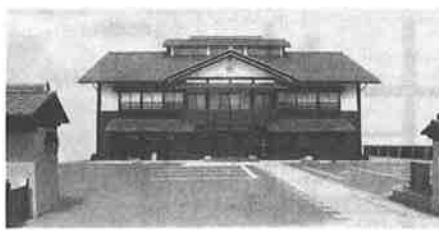
丸岡町霞1丁目13-1 TEL (0776) 66-1276 (代)

建設にあたっては、城下丸岡にあふましい和風温かみのある木造建築二階建てで、周囲の景観や環境との調和を図り、構造、形状、色彩に配慮したほか、広いエントランス、ロビーの空間から多目的ホールが見通せる外光も取り入れた会館であります。特に、一階のこども室、広い児童室等は地区の要望を取り入れたのをはじめ、身障者用トイレやエレベーターの設置により高齢者や障害者の皆様にも利用しやすい施設にいたしました。