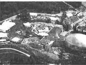
「恐竜エキスポ2000」の勝山メイン会場

層の多様な知的ニーズに応えることができる最高水準の施設、内容となっております。 また、同館のオープンを機に去る七月二〇日から九月十七日まで開催いたしました「恐竜エキスポふくい二〇〇〇」につきましましては、多くの方に「来場いただき大成功を取ることができました。これも、東京福井県人会の皆様をはじめ、多くの皆様のご支援、ご協力の賜物であり、心から厚くお礼申し上げます。 今後、この恐竜博物館が、二十一世紀という輝かしい未来へ向け、恐竜学術研究の中核施設としてとどまるべく立てつけ