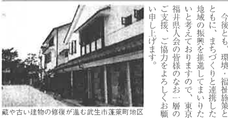
蔵や古い建物の修復が進む武生市蓬萊町地区

日本には福の字のつく県が三つある。福岡、福島そしてわが福井。地図を見ると、この三つの県が直線上に並び、この三つが、それぞれ、地理的に必要のない時代である。観光が、豊かな自然と、そこに住む人の暖かい心は同じ。そこで考えたのが「福の国」構想だ。えいたの「福の国」構想だ。味がある。人間が生きていく上で、幸福は究極の目的だといつてもいいだろう。「福」に満ちあふれた「福の国」が全国に三つあることを、三県が運動しながらキャンペーンを行う。不変