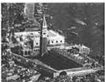
サンマルコ広場は「世界でも美しい空間」