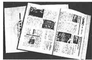
東京福井県人会の創立100周年記念誌「100年のあゆみ」

す。 百周年記念の折に、「一〇〇年のあゆみ」と題して刊行されたすばらしい記念誌を讀ませていただくに任せ、その時、その時に、こよなく故里を愛し、故郷に思いを寄せながら東京で活躍された多くの先達に頭を下る思いで一杯であります。 百年余も続いている県人会はそうざらにあるわけではなく、聞くところによると、奈良、佐賀県人会について、三番目に古い県人会だそうである。