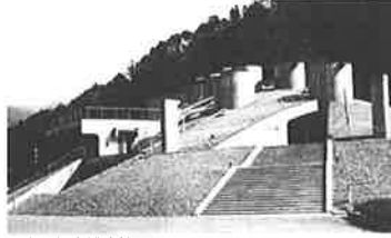
三方町縄文博物館 電話 0770-45-2270