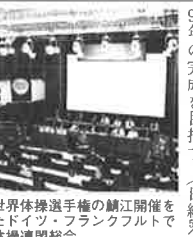
94年の完成を目指す。(日経総) 1995年世界体操選手権の鯖江開催を決定したドイツ・フランクフルトの国際体操連盟総会

丹南プラザは両市はじめて11市町村からなる丹南地域の産業振興拠点で、95年に鯖江市で開催される世界体操選手権競技大会の設する広域的産業振興施設(通称・丹南プラザ)の基本計画をまとめた。丹南プラザは両市はじめて11市町村からなる丹南地域の産業振興拠点で、95年に鯖江市で開催される世界体操選手権競技大会の設する広域的産業振興施設(通称・丹南プラザ)の基本計画をまとめた。