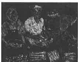
朝市(洋画) 加藤直子