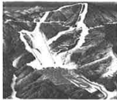
県内最大規模の今庄 365 スキー場、鉢伏山山頂からは日本海が望めます。