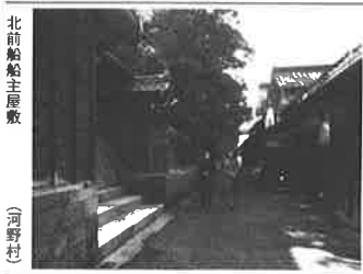
北前船主屋敷 (河野村)

私は東京千代田に本社を持ち印刷業を営んでいるが、時間をみつけてはゴルフ、釣りに、囲碁等の趣味を楽しんでいる。ゴルフは毎週休日を利用して芝生の上を歩いて、釣りは海釣り、川釣りという釣りが多量に釣れる時などは翌日お得意様にお届けしているが、新鮮な鮎はどのお客様にも一様に喜ばれ一石二鳥だ。 また囲碁は私の頭の訓練としてこれも欠かすことのできない趣味のひとつといえる。 囲碁の攻防にしばし集中することは、私の事業上での意志決定に何等かの形で役立っているかも知れない。 事業といえ最近若手人が不足している故もあって、どの企業も人手不足に悩んで、人手不足で倒産の憂き目にあう企業もあることである。 私の営む印刷業は近頃は設備や機械がすべてコンピュータ化