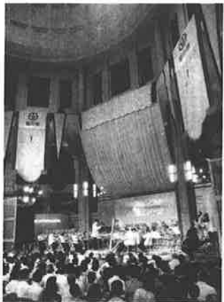
JR東京駅で開幕した福井県をPRする「とうきょうエキコン」

特徴ある福井を全国にアピールし、本県のイメージアップを図らうと、県はことしから首都圏を中心としたマスコミ、文化関係者向けの情報誌を定期的に発行する。年二回発行の予定。情報誌はコミュニケーション推進事業の一環で、昨年はコミュニケーションマークを導入し、一般向けの情報誌「福井物語」を発行した。今年には新たな情報誌の創刊とエコーはがき五十万二月に発行する予定。 特微ある福井を全国にアピールし、本県のイメージアップを図らうと、県はことしから首都圏を中心としたマスコミ、文化関係者向けの情報誌を定期的に発行する。年二回発行の予定。情報誌はコミュニケーション推進事業の一環で、昨年はコミュニケーションマークを導入し、一般向けの情報誌「福井物語」を発行した。今年には新たな情報誌の創刊とエコーはがき五十万二月に発行する予定。