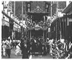
放生会まつり(小浜市)