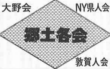
大野会 NY県人会 郷土各会 敦賀人会