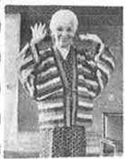
福井県に生れた仕合せをしみじみと感じるようになった。

今日のように都会に棲んでいると季節の移り変わり、けじめのないものがはつきり、覚えないうものがある。ファッションはシーズンを早目に街に流すし、暦を見直すところがある。福井県、といっても私の生れた頃の敦賀と福井市との交通の便は今日のようにではなかった。自然に県庁の所在地と判っていても何かと都的なものは京都に足が向いた。社会人になった頃には福井県に生れた仕合せをしみじみと感じるようになった。