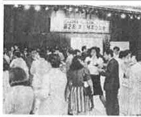
東京勝高会が五月三十一日千代田区の日生会館で開かれ、勝山高出身者で東京や関東地方に在住している二百四十人が出席親睦くを深めた。