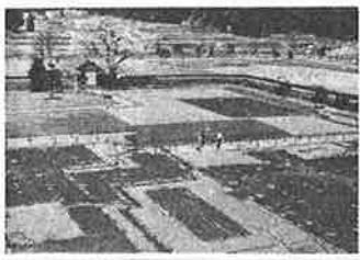
朝倉氏遺跡の発掘は四十二年から始まり、四十六年に国の特別史跡に指定された。発掘が進んで巨大な城下町が地下に残っていることがわかった。

今年で満二十年を迎える朝倉氏遺跡環境整備事業が、六十一年度の日本建築学会賞を受賞した。住民と行政が一体となつて高い水準の調査と町並みや遺構の整備保存を行ってきたことが評価された。 朝倉氏遺跡で受賞の対象となったのは、県立朝倉氏遺跡資料館と朝倉氏遺跡保存協会の二団体。同賞は建築に関する学術・技術・芸術の進歩を図り建築文化を高めるため二十四年に設けられた。受賞の理由は、「土地固有の文化的価値を具体的にわかりやすく、学術的にも正確に史跡公園として整備すること、成功している。その社会的先駆性と豊かな獨創性は高く評価できる」としている。 朝倉氏遺跡の発掘は四十二年から始まり、四十六年に国の特別史跡に指定された。発掘が進んで巨大な城下町が地下に残っ